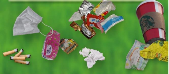
Plakat: KKA GmbH

DAMIT GEWINNST NICHT NUR DU, DIE UMWELT AUCH!